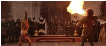
Una scena del film Il racconto dei racconti

Ed ecco che nelle sale arriva "Il Racconto Dei Racconti" di Garrone, l'adattamento di tre delle fiabe di Basile raccolte ne "Lo Cunto De Li Cunti".