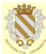
Stemma della Repubblica di Crema

one, entrò in città e proclamò la "Repubblica di Crema", annessa due mesi dopo alla "Repubblica Cisalpina" in vigore fino al 1815, anno nel quale la città fu assorbita nel regno Lombardo-Veneto. A quel punto la città perse quasi ogni importanza a livello politico regionale: fu infatti accorpata a livello amministrativo con la rivale storica Cremona, dalla quale non riuscirà più a separarsi.